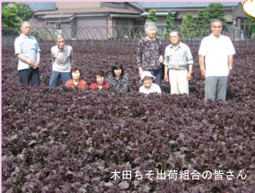
木田ちそ出荷組合の皆さん