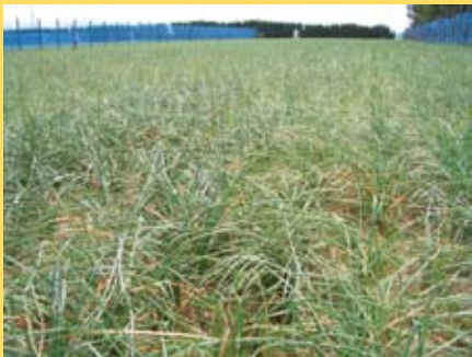
1年掘のらっきょう