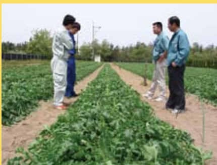
収穫まであと1週間あまり