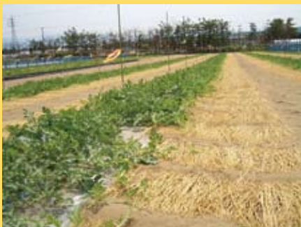
すいかができそうなころに わらを敷き、実を傷めないようしています。