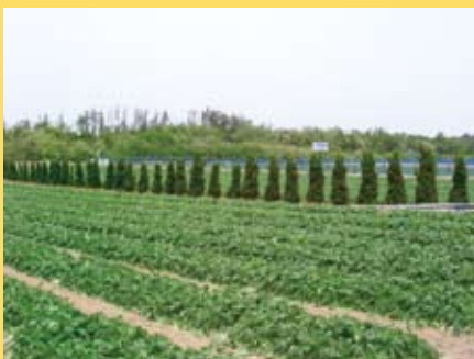
こちらはだいこん畑