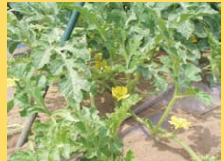
すいかの実が徐々に大きくなり、 収穫は7月上旬ごろから