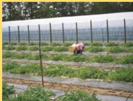
1本の木で2個くらいなるように 実の摘み取りやつるの整理の作業