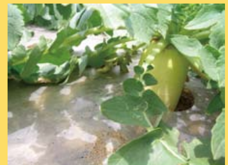
収穫(5月下旬ごろ)間近です