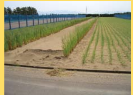
砂丘地域では、麦科の作物を 防砂の為に植えています。